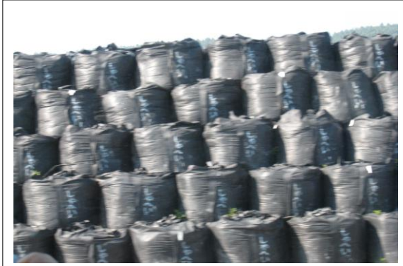
除染放射性廃棄物が詰まった袋の山（富岡町）