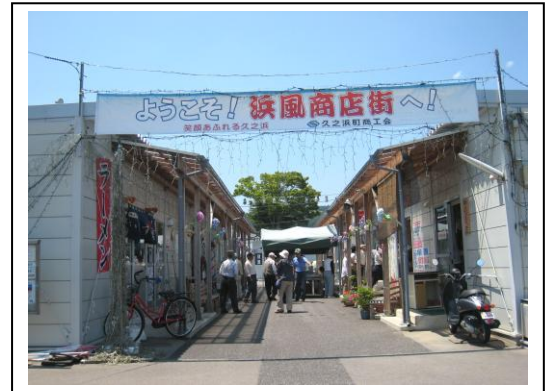
仮設の浜風商店街（いわき市）