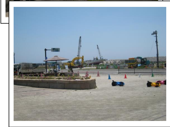
陸に打ち上げられた船