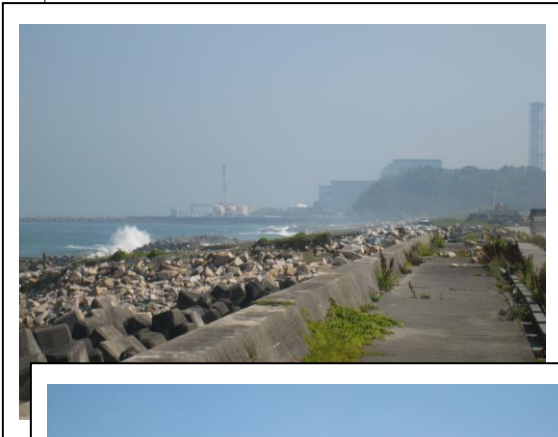
福島第二原発を遠望する。