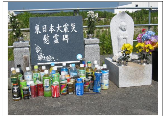
東日本大震災慰霊碑