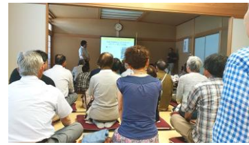
おらってにいがた太陽光発電について説明を受ける