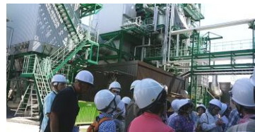
三条木質バイオマス発電所

「質の濃い見学会だった」「充実した一日だった」などの感想が寄せられました。 (裏面掲載の感想をご覧ください。)