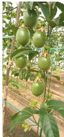
瀬波南国フルーツ園