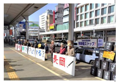
「原発事故避難できる? どうする?長岡!」の絵とパネル。「柏崎刈羽原発再稼働 NO!」のカード。そしてフレコンバッグ。