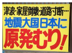
「能登地震 次は新潟か?」「原発キケン! 今こそ廃炉」のビッグプラスター