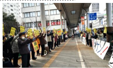
声高らかに「ノーモア・フクシマ！」「再稼働ストップ！」とアピール